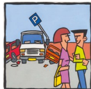
Parkeer en manoeuvreer schade

Voor voertuigen tot 3.500 kg geldt een eigen risico van € 1500,- excl. btw (art. 14.1).